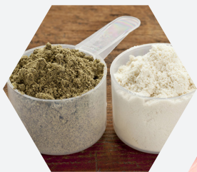
Mezcla de polvos