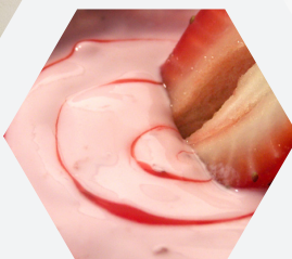
Adición de sabores