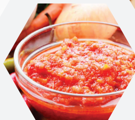
Desintegración de sólidos